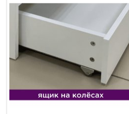
ящик на колёсах